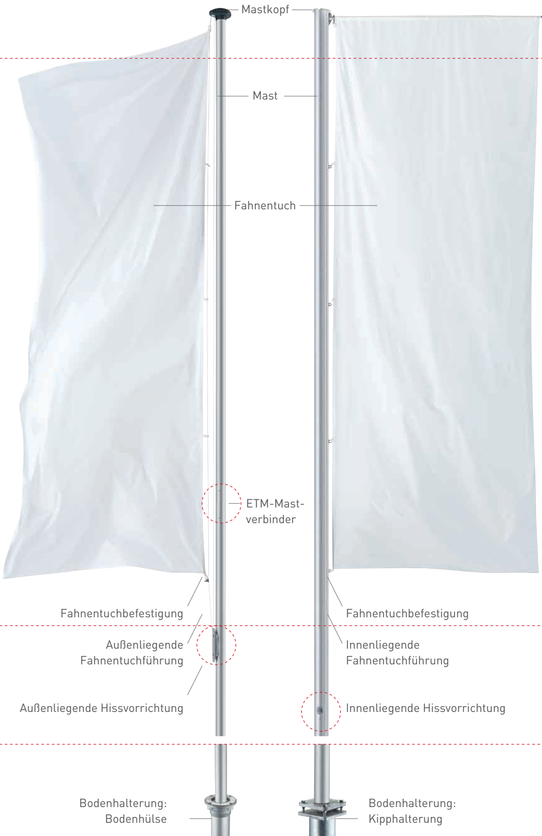
Mast mit Ausleger